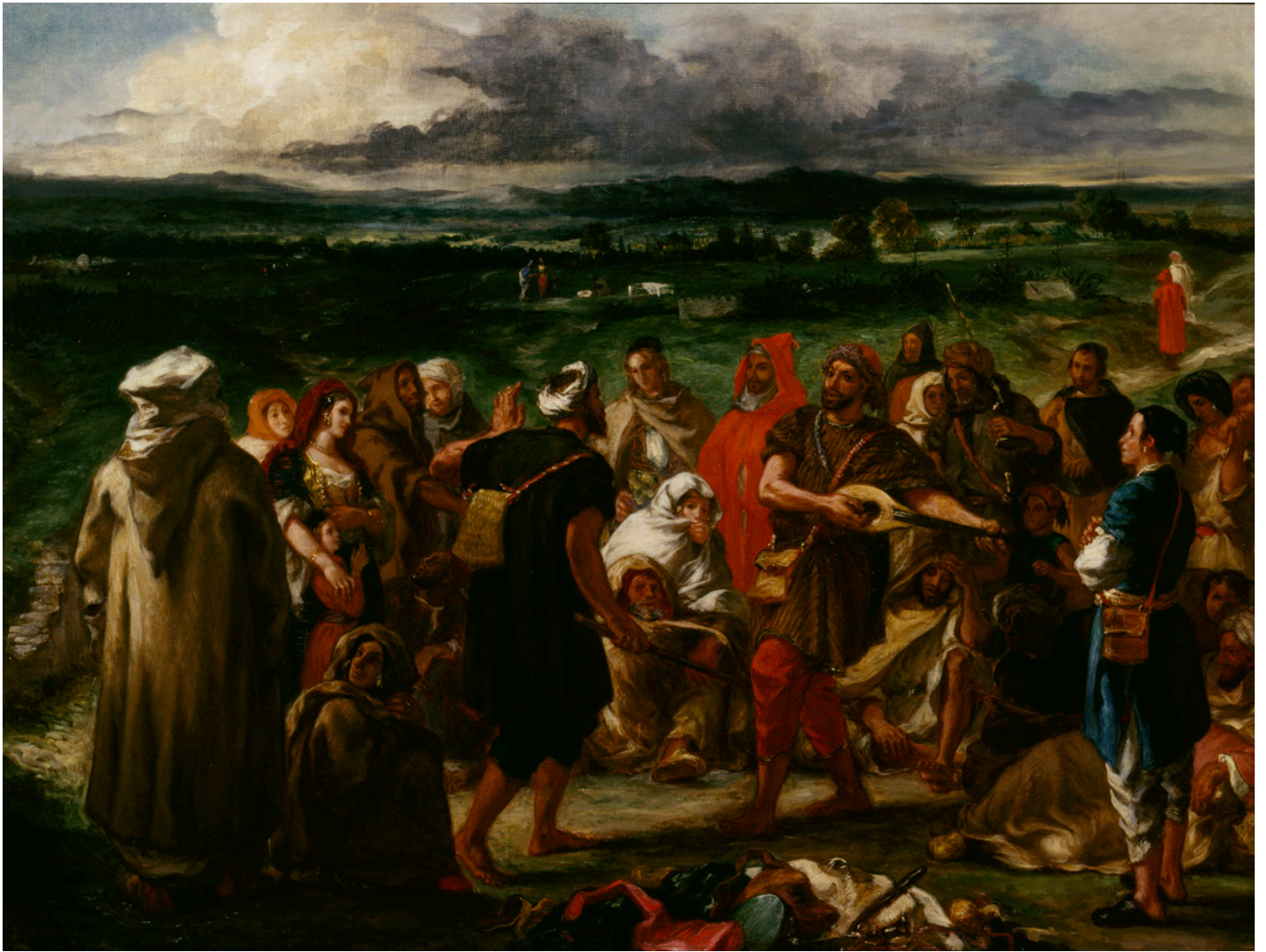
Eugène Delacroix (1798-1863)